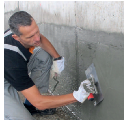
PCI Barraseal ist plastisch-geschmeidig. Poren und Vertiefungen werden leicht und schnell geschlossen.