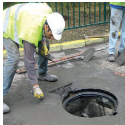
Einbetten eines Schachtringes mit PCI Repafast Tixo